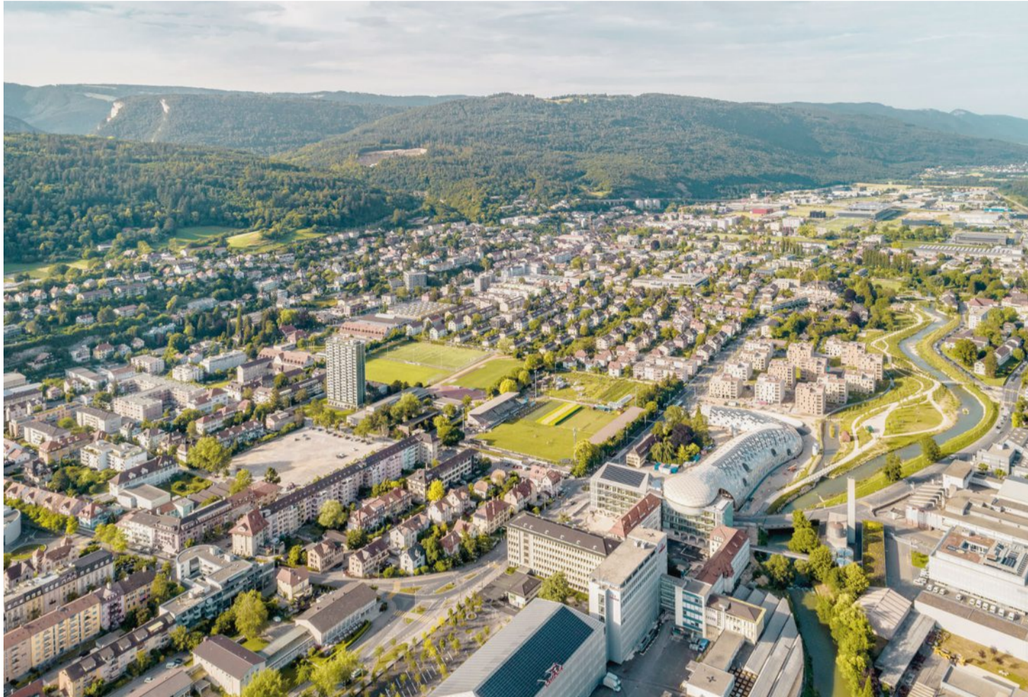
Quasi als Pufferzone zwischen den Quartieren Dufour und Champagne steht das alte Gurzelen-Stadion. Künftig soll eine Überbauung mit bis zu 400 gemeinnützigen Wohnungen die beiden Stadtteile verbinden.

Der Gurzelen-Perimeter ist hoch attraktiv, mit dem Umzug der Fussballer ins Bözingenfeld ist hier eine Landreserve für Wohnnutzung in einer Grösse frei geworden, wie es sie in Biel wohl erst wieder geben wird, wenn die SBB den Güterbahnhof dereinst aufgeben sollten. Sie umfasst nicht nur das Fussballstadion, sondern auch den angrenzenden Gurzelen-Parkplatz. Kommt hinzu, dass sich das Gebiet südlich der Gurzelen in den letzten Jahren enorm entwickelt hat: Die Swatch steht kurz vor dem Abschluss ihres neuen Hauptsitzes, ein Repräsentationsgebäude in Schlangenform. Bereits in Betrieb ist das neue Produktionsgebäude von Omega. Die Pensionskasse Previs hat zudem angrenzend an das Naherholungsgebiet Schüssinsel, ebenfalls in den letzten Jahren realisiert, bereits eine Wohnüberbauung fertiggestellt. Auf der Gurzelen sollen nun weitere Wohnungen entstehen; aber auch ein öffentlicher Park und angrenzend an diesen